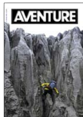
À paraître prochainement la revue AVENTURE n°124.