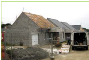
Les logements pour personnes âgées ou handicapées (ci-dessus), le rechapage du monument aux Morts (ci-dessous) et la plate-forme multisports (ci-contre).

La construction des trois logements réservés aux personnes âgées ou handicapées avance normalement, ce qui laisse envisager la remise des clés aux futurs locataires courant novembre 2009. L'implantation de la plate-forme « multisports » à proximité de l'école Saint-Jean est en grande partie réalisée. Les travaux de finition (clôture, muret) ainsi que la pose de mobilier urbain (bancs, panneaux de signalisation...) seront terminés pour la date de l'inauguration envisagée début septembre. Les travaux d'assainissement collectif entre le lieu-dit « les ruisseaux » et le port de Saint-Marc sont terminés. Le rechapage du monument aux Morts a été réalisé.