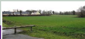
Terrain à Runales du futur lotissement Eco-quartier.

Madame le maire rappelle que le Conseil municipal lors de la séance du 14 mai 2009, a délibéré sur les orientations générales et a retenu les projets suivants :