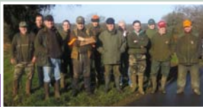
Les chasseurs de Tréméven.