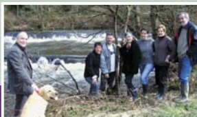
Quelques habitants de Saint-Jacques opposés à l'arasement du déversoir.

Extrait de ce courrier : ...« Pas convaincus sur la nécessité et l'absence d'alternatives, très étonnés de l'urgence apparente et soudaine, soucieux des priorités d'utilisation des fonds publics si rares, non consultés dans la conduite du projet... (les 224 signataires) se déclarent opposés au projet de suppression