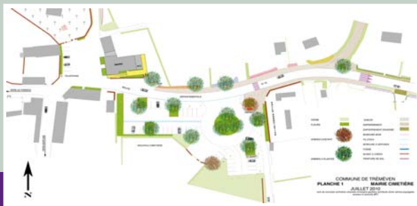
Plan du projet de l'aménagement paysager du Bourg.