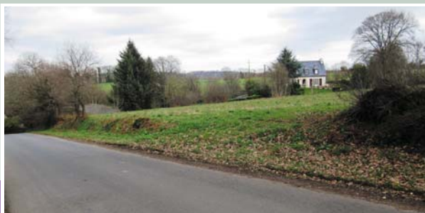
Terrain du futur assainissement de Saint-Jacques.

Madame le maire informe les membres du Conseil municipal de la consultation en procédure adaptée concernant l'assainissement collectif eaux usées de