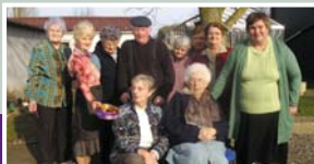
La joyeuse équipe des aînés.