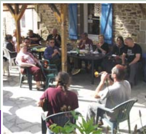
À la terrasse du Siam café.