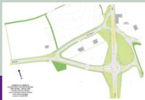
État actuel de l'entrée du Bourg.

Madame le maire a précisé que la commune compte mettre tout en œuvre pour concilier au mieux une logique de développement durable et une prise en compte du contexte budgétaire difficile. En ce qui concerne le contrôle des performances thermiques actuelles de la mairie, il sera fait appel à un thermicien du Pays de Guingamp.