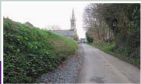
La route de Lizelec'h vers le Bourg après travaux.

Le maire saisit l'occasion pour faire aussi le point sur les petites dépenses à prévoir : pose de stores à lamelle pour les deux fenêtres de la mairie et remplacement d'une vingtaine de sièges de la salle de l'école.