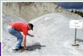
Prélèvement de matériaux avant analyse dans le laboratoire de la carrière.

Madame le maire rappelle que la commission de suivi carrière, au complet, s'est réunie le samedi 4 septembre