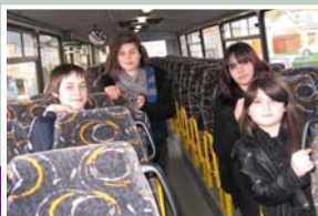
En route pour le collège de Plouha.

Madame le maire suggère au Conseil municipal de mener une réflexion avec la commune de Lanvollon afin d'étudier la possibilité de création d'un regroupement pédagogique intercommunal.