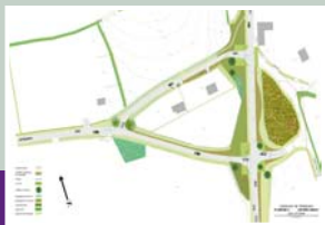
Simulation pour l'entrée du Bourg.