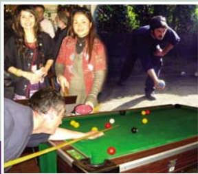
Ambiance thaïlandaise, allée de boules bretonnes et billard au Siam café.

marie-laure.bournas@orange.fr - Fermé le mardi