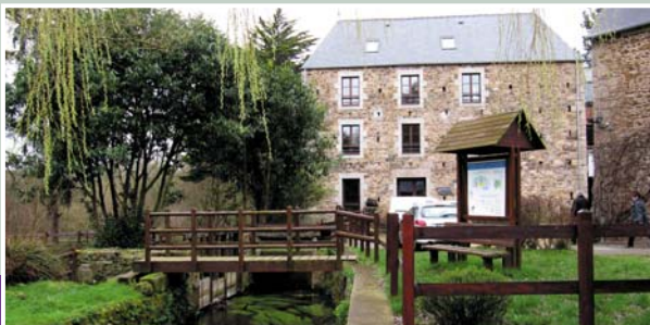
La Communauté de Communes de Lanvollon-Plouha est basée au Moulin de Blanchardeau (Lanvollon route de Guingamp).

Le Pôle enfance jeunesse est défini comme une structure d'accueil pour les plus de 3 ans, la volonté étant de regrouper les différents services communautaires sur un même lieu afin de faciliter l'accès au plus grand nombre, de rationaliser les différentes offres et de créer un lieu unique d'animation.