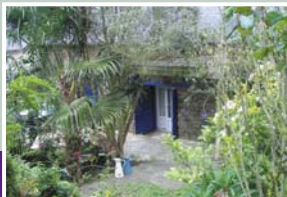
Le jardin d'hôtes de Kerpuns.