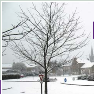
Le Bourg sous la neige du 1 er décembre 2010.