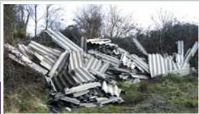
Décharge sauvage à Coat Men.

Madame le maire fait part au Conseil municipal de la plainte déposée auprès des services de gendarmerie suite au dépôt dans la nuit du 21 au 22 février 2010 de tôles amiantées à Coat Men sur le parking du chemin de randonnée.