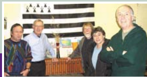
La toute nouvelle équipe des Veillées.