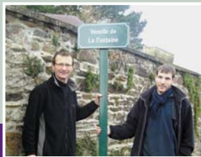
Baptême d'une rue derrière l'église.