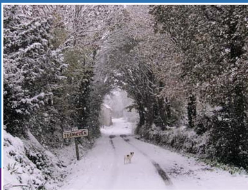
À bientôt à Tréméven.