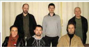
Le nouveau bureau de Tréméven à la patate 2011.