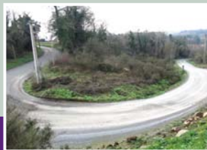
Emplacement du futur atelier sur la route de Trévère.

Un effacement du réseau se trouvant à proximité de l'atelier sera réalisé. Depuis juillet 2010, plus aucun camion ne remonte cette route.