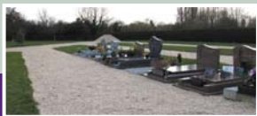
Le nouveau cimetière après la dépose du maërl.

Travaux à effectuer (compte rendu de la commission travaux et route du 6 février 2010).