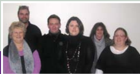
Le nouveau bureau du Comité d'animation 2011.