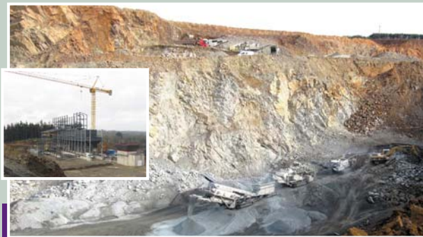
La carrière et la construction d'un bâtiment pour le concassage et le criblage des matériaux (fév. 2011).

En effet toute l'exploitation cesse côté Trévélec, et l'entreprise va engager son projet de réhabilitation de