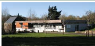
Le Pôle enfance jeunesse sera implanté dans le prolongement des Services administratifs de Blanchardeau, près du parking.

Le Conseil municipal, émet un avis favorable à la mise en place d'un CIAS étant entendu qu'il n'y a dessaisissement d'aucune compétence des Centres communaux d'action sociale (CCAS)